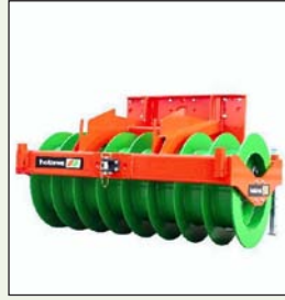
Holaras STEGO EGO / PRO silovalse