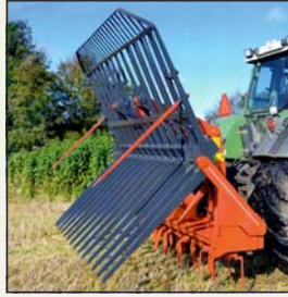
EK AGROMASKINER Combisilosvans