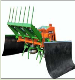
Holaras Jumbo og Viking